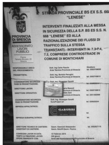
L'avviso di sequestro dell'opera.

A bloccarli è stato l'intervento del Nucleo Operativo Ecologico dei Carabinieri che, in data 21.12.2010, su ordine della Procura della Repubblica, ha messo sotto sequestro il cantiere. Le ragioni non sono note.