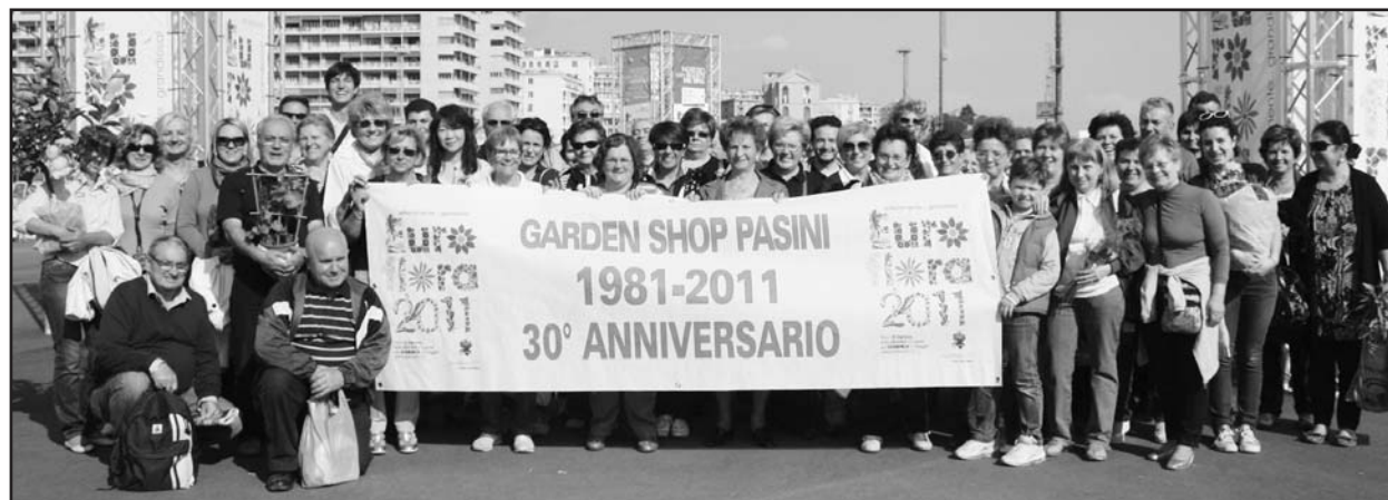
I partecipanti alla fiera internazionale INTERFLORA a Genova.

Il Garden Shop Pasini, nel ricordare lo sconto del 30% per l'addobbo floreale, ha in serbo una grande sorpresa entro la fine dell'anno del trentesimo anniversario.