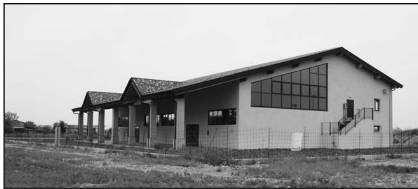
La nuova scuola di S. Antonio è prevista vicino al "polivalente". E gli aerei?