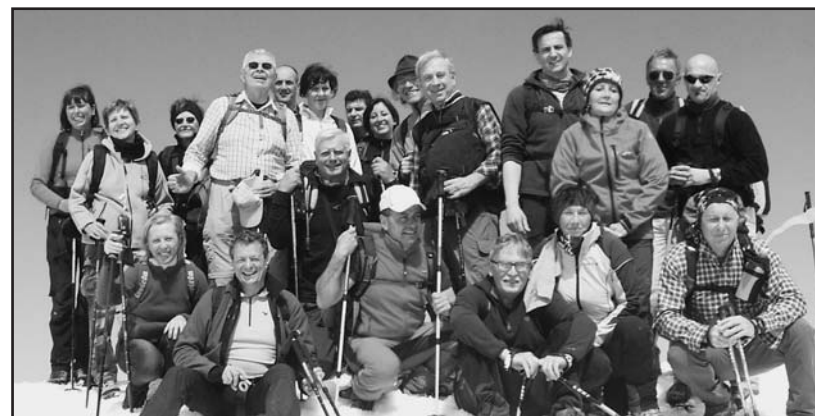
Quanto è bello arrivare in vetta.