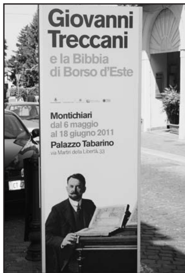
Il manifesto della mostra.

L'opera fu portata a termine nel 1461 e, dopo varie vicissitudini, tornò a far parte del patrimonio artistico italiano nel 1923. Oggi, a 550 anni dalla sua nascita, i caratteri ed i colori usati per le miniature mantengono intatte la vivacità e la brillantezza originarie.