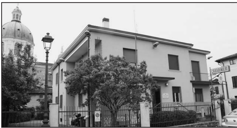
L'attuale caserma dei carabinieri costruita negli anni cinquanta.

Per Montichiari e paesi limitrofi Fisioterapista-massaggiatore a vostro domicilio: riabilitazione, recupero funzionali post traumatico e chirurgico, massaggio terapeutico ed estetico tel. 3331937638 ore pasti