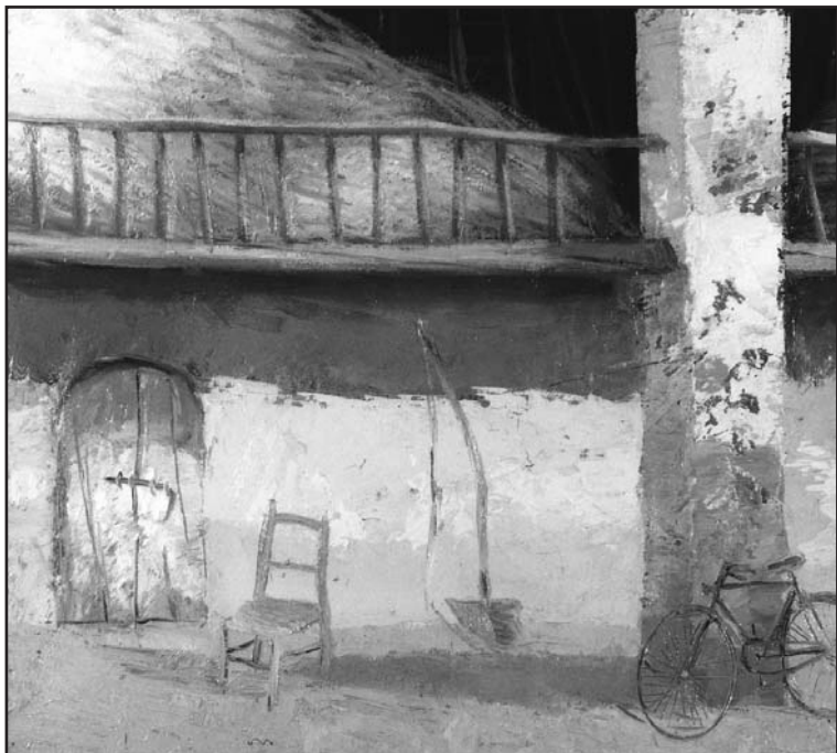
Giacomo Bergomi, Portico, particolare.

Il saggio principio contadino del fieno sul fienile come